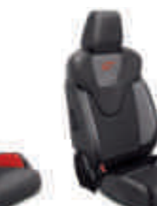
ST2 Frente de asiento en cuero parcial Negro Charcoal con apoyo lateral en Gris Storm