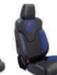
ST2 Frente de asiento en cuero parcial Negro Charcoal con apoyo lateral en Azul Racing