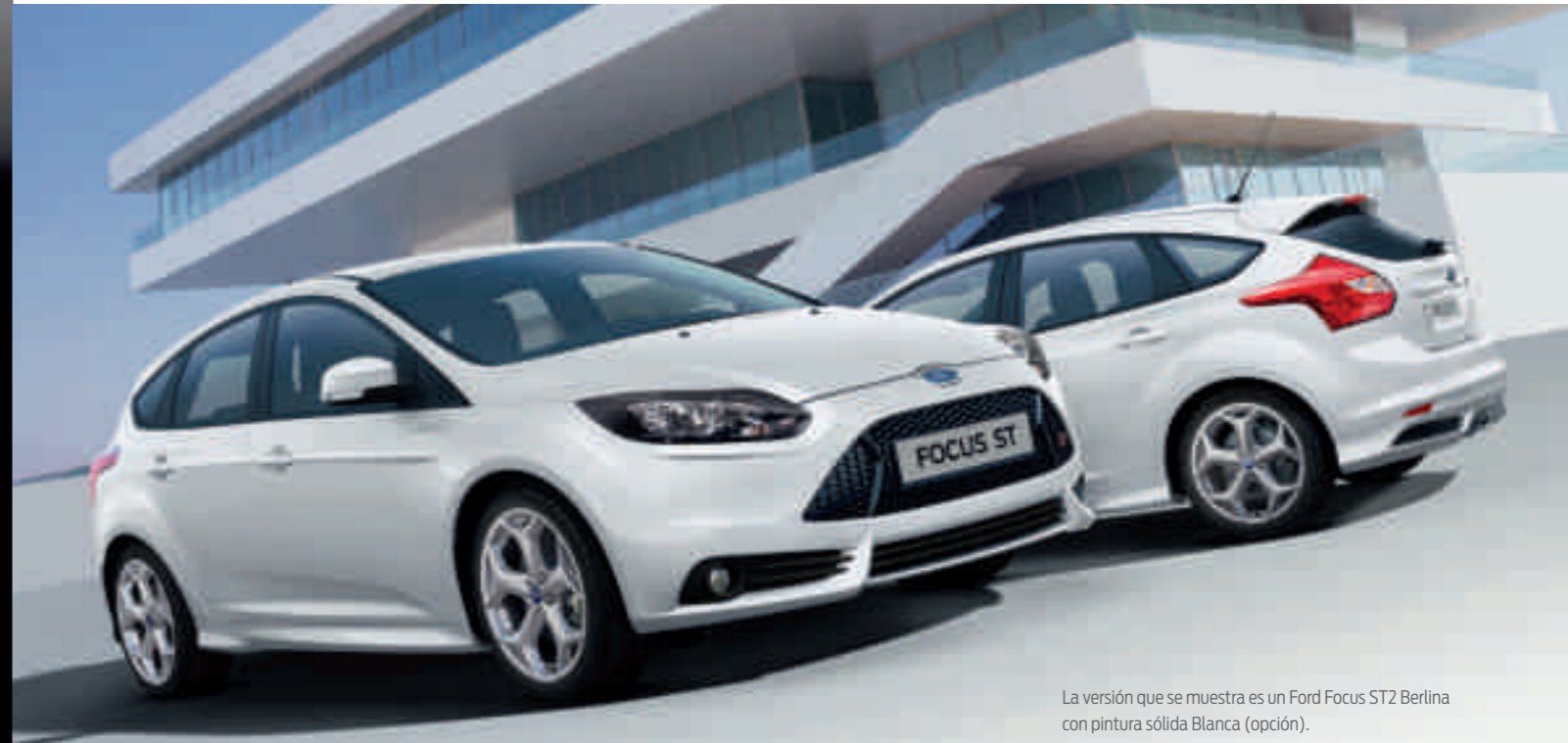
La versión que se muestra es un Ford Focus ST2 Berlina con pintura sólida Blanca (opción).

Con unas prestaciones impresionantes, un potente sonido de motor y un diseño dinámico, el nuevo ST es la máxima expresión de la deportividad.