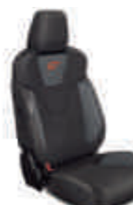
ST1 (no disponible) Frente de asiento en tela Lux Negro Charcoal con apoyo lateral en Gris Antracita