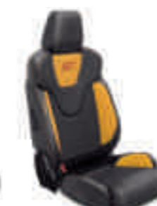
ST2 Frente de asiento en cuero parcial Negro Charcoal con apoyo lateral en Amarillo Scream