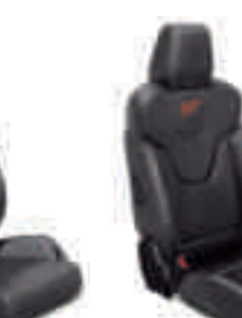
ST3 Frente de asiento y apoyo lateral en cuero Windsor Negro Charcoal

*El color blanco y los colores especiales y metalizados son opciones con coste adicional.