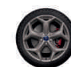
Llantas de aleación 18" en acabado Gris magnético con pinza de freno en color rojo (Opción)