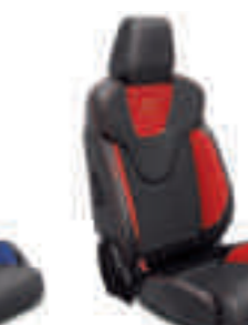
ST2 Frente de asiento en cuero parcial Negro Charcoal con apoyo lateral en Rojo Race