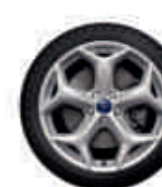
Llantas de aleación 18" (De serie)