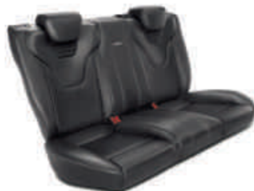
Asientos traseros Recaro con 3 plazas individuales con tapicería en cuero Windsor Negro Charcoal (De serie en ST3)

Nota Las imágenes que aparecen en este catálogo son solo ilustrativas de los colores de carrocería y pueden no coincidir con las especificaciones actuales. Los colores y tapicerías reproducidos en este catálogo podrían mostrar variación respecto a la realidad debido a las limitaciones del proceso de impresión.